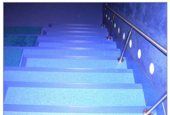
Kinderkino, Atlantis Kinderland