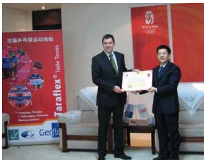
BOCOG – 12. November 2007 Unterzeichnung Partnerschaftsvertrag