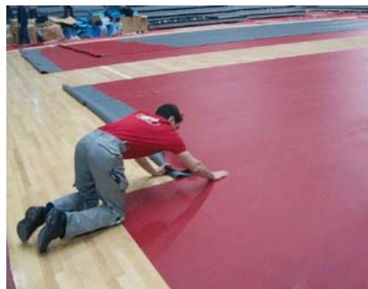
Verlegung Taraflex® Tischtennis

Als offizieller Lieferant der Olympischen Spiele seit 1976, ist der französische Sportbödenhersteller auch 2008 für die Wettkampfflächen der Disziplinen Volleyball und Tischtennis zuständig.