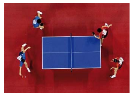
Gerflor ist Lieferant für 5.307 m 2 mobile Spielfelder für den Tischtennis-Bereich. Qualität: Taraflex® Tischtennis.

Die 14 Volleyballspielfelder an sieben verschiedenen Orten und die zwei Tischtennisbereiche, entsprechen über 15'000 Quadratmetern Spielfläche. Mit seiner Marke Taraflex ist Gerflor weltweiter Marktführer für Indoor-Sportböden, mit insgesamt über 30 Millionen verlegten Quadratmetern.